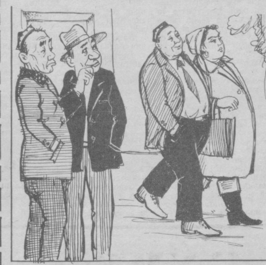
— Эри хотин бирдан кўчиб кетибдики?! — Дўконни бутунлай ютиб юборишди-да! Мусавир М. ЖУРАЕВ.

1982 йилги давлат заеми облигацияларини Ўзбекистон Жамгарма банки муассасаларига сақлаш учун қўйган фуқаролар 1993 йил 1 февралга қадар облигациялар суммасини махсус счётларда сақлаш учун қайта расмийлаштиришлари зарур. Улар кейинчалик шу суммаларни Ўзбекистон Республикасининг 12 фойзлик ички ютуқли заеми облигацияларига алмаштириладилар.