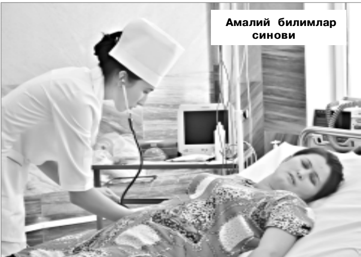
Амалий билимлар синови

– Аввало, «Хамшира – 2014» республика кўрик-танловида иштирок этганлигимдан жуда хурсандман. Гўзал ва мафтункор Сирдарё вилояти аҳолисининг самимийлиги, меҳмондўстлиги кайфиятимизни янада кўтарди. Айниқса, Сирдарё вилояти ҳокимлигида Ўзбеки-