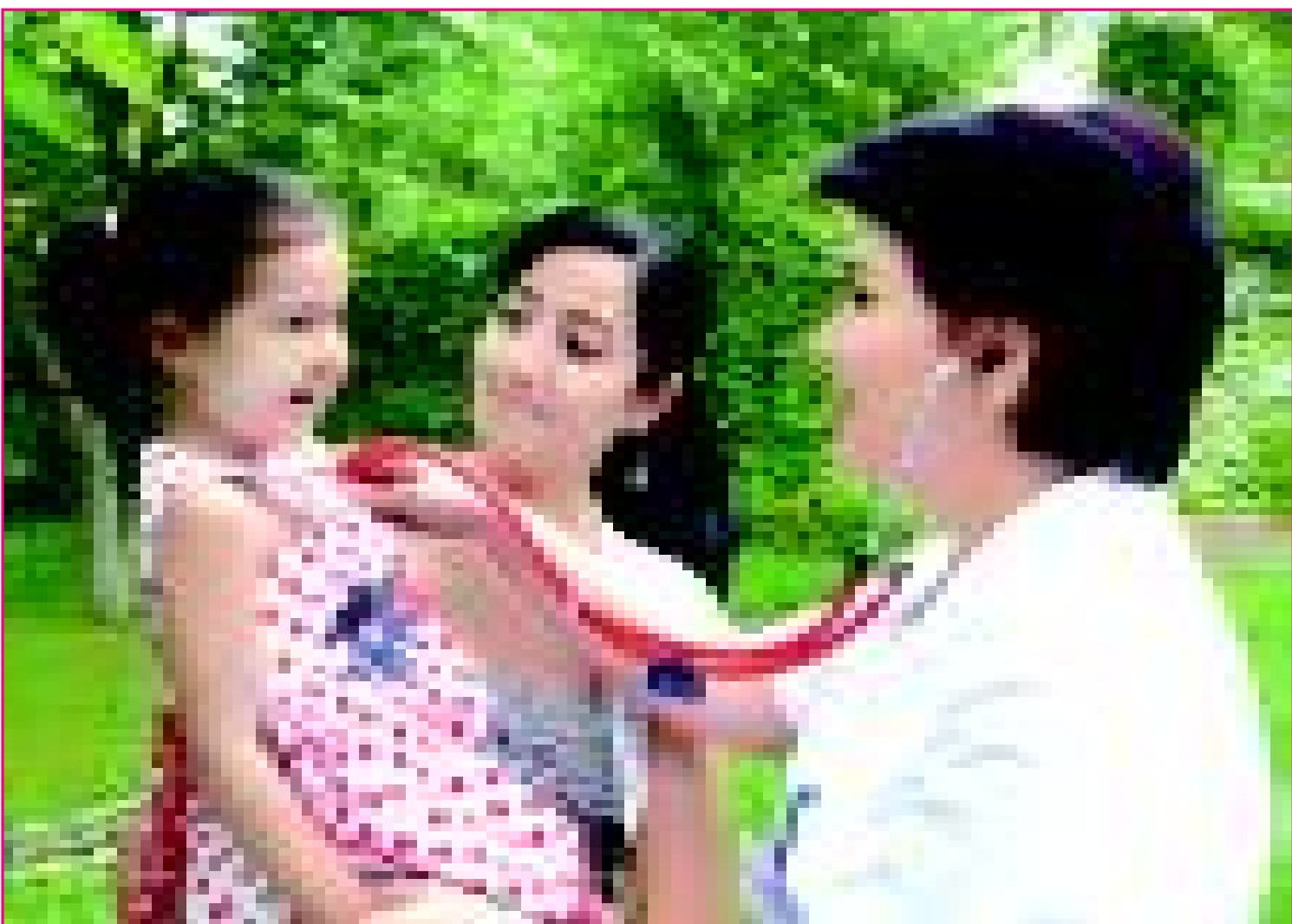
Дард кўрмагин асло Болажон, Соғлом ўсгин, доим бўл омон.

Газета 1995 йил октябрь ойидан чиқа бошлаган • www.uzssgzt.uz, info@uzssgzt.uz • 2013 йил 23 август • № 34 (951)