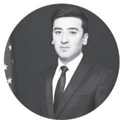
Ихтиёр МАҲМАТҚУЛОВ, Халқ таълими вазирлиги бош мутахассиси: — Албатта.

— Вилоятимизнинг энг чекка ҳудудидаги мактабда олий маълумотли мутахассисларга эҳтиёж борлиги учун мени ишга таклиф қилишяпти. Бунда менга қандайдир имтиёзлар белгиланганими?