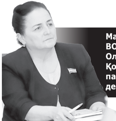
Мақсуда ВОРИСОВА, Олий Мажлис Қонунчилик палатаси депутати.