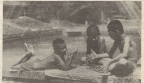
— Кеча шу ердан-чи мана бу-ундоғ балиқ тутволдим

— Ойи, бугун боғчада ким тез ухлаб қолиш мусобақаси ўтказдик. — Унда ким қолиб чиқди, қизим? — Боғча опамлар. *** — Салимжон, «Менинг кучүгим» мавзусида ёзиб келган иншонг Қодирники билан бир хил-ку, — деди ўқитувчи. — Менинг кучүгим йўқ, Шунга Қодир иккаламиз унинг кучүги ҳақида ёздик. *** — Раҳима, математикадан масалани ким ечиб берди, — сўради ўқитувчи. — Билмасам... — Ия, нега билмайсан? — Эрта ухлаб қолган бўлсам, қаяқдан билай.