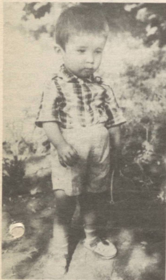
—Машинамни Нодийнинг челақчасига айишганимни ойим билса уйишаймикан?..