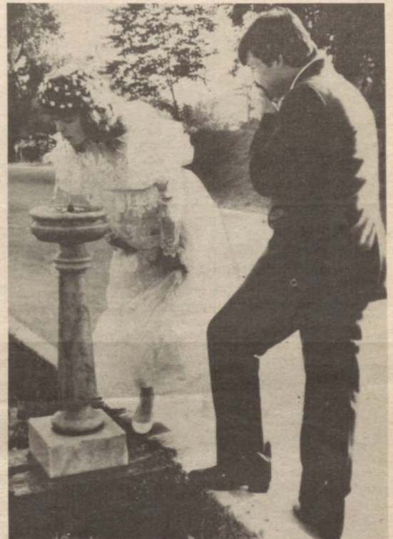
Ҳижронда куйган юракни Босмагай сув тафти ҳам.