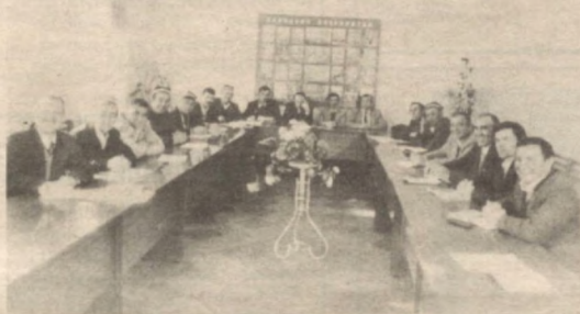
Суратда анджонлик тингловчилар.

ни ошириш бўйича коллеж қошида доимий курслар ташкил этилган эди. Биргина ўтган 1995 йилнинг ўзида республикамизнинг барча туманлари почта боғламаларининг раҳбарлари коллеждаги малака ошириш курсларида таҳсил олдилар. Яқинда туман электралоқаси боғламалари раҳбарларининг малакасини оширишга мўлжалланган «Бозор муносабатларида бошқаришнинг