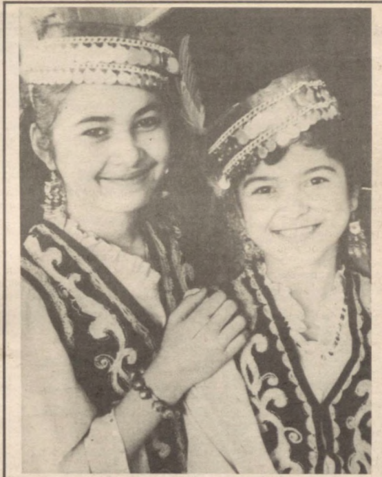
Қизлар кулгусида баҳор!

зумларда у ёки бу шаклда да- вом этиб келди. Бироқ ўтми- шимиз, тарихимиз, динимиз, қадриятларимизни қоралаш одат тусига кирган шўролар даврида эса аёлларга эътибор сусайди. Бу даврда аёлларимизнинг «юзини очиш» баҳонасида қолхоз даласига улоқтирилди ва очикчасига асоратга солинди. Қадимда энг мумотзо кадр-қимматга сазовор бўлган Аёл янги замонга келиб жабрланди. Мамалан, жаҳолат қурбони деб бонг урилган актриса Турсуной тақдири билан қарсақбозлик