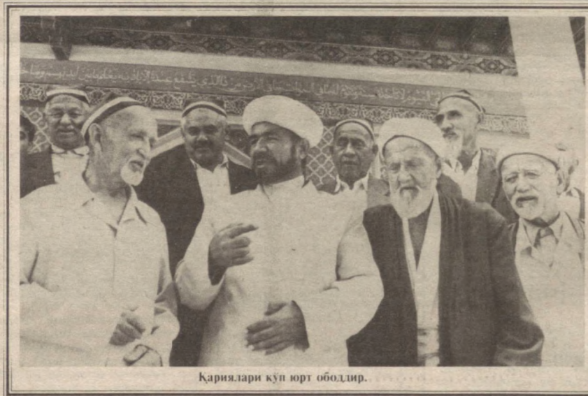
Қариялари кўп юрт ободидр.

«Аскара нима?» деб сўраган-лар. Пайғамбар: «Улар мингларча бўлатуриб ўлимдан кўркиб, ўз мам-лакатларидан чиққан (кишилар-дир). Шунда Худо уларга «ўлинг» деган. Сўнгра уларни шу (Наврўз) кунда тирилтириб, руҳларини ўзларига қайтарган. У Осмонга буюрган, Осмон уларнинг устила-рига ёлғир ёғдирган. Шунинг учун одамлар Наврўз кунни сув сепи-шни расм қилиб олганлар», — де-ган. Кейин пайғамбар ҳолвани еб жомни (синдириб) сўхбатдошлари-га тақсим этган ва «Қошки, биз учун ҳар кун Наврўз бўлса эди» — деган.