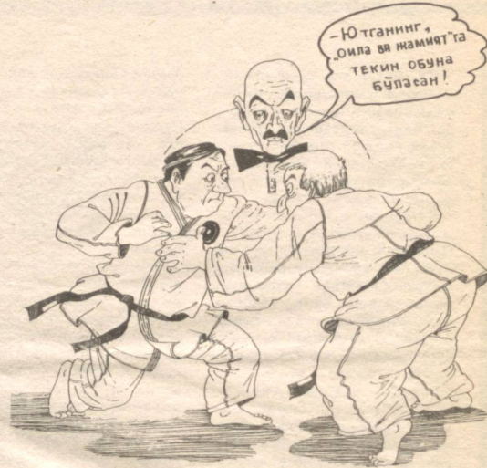
Муаллиф: С. САЛОҲИТДИНОВ