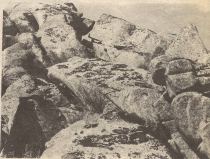
Суратчи: Фулом ПИРИМОВ