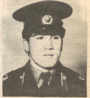
АЗАМАТ ҲАРБИЙ ХИЗМАТДА. 1986 ЙИЛ

қоришиб яшаса керак», дея хомуши тортиди.