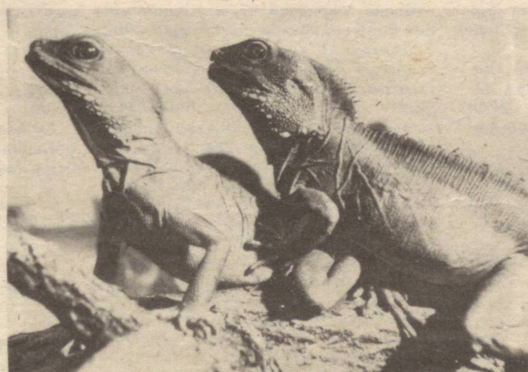
ҲАММА НАРСА ЖУФТ ЯРАТИЛГАН