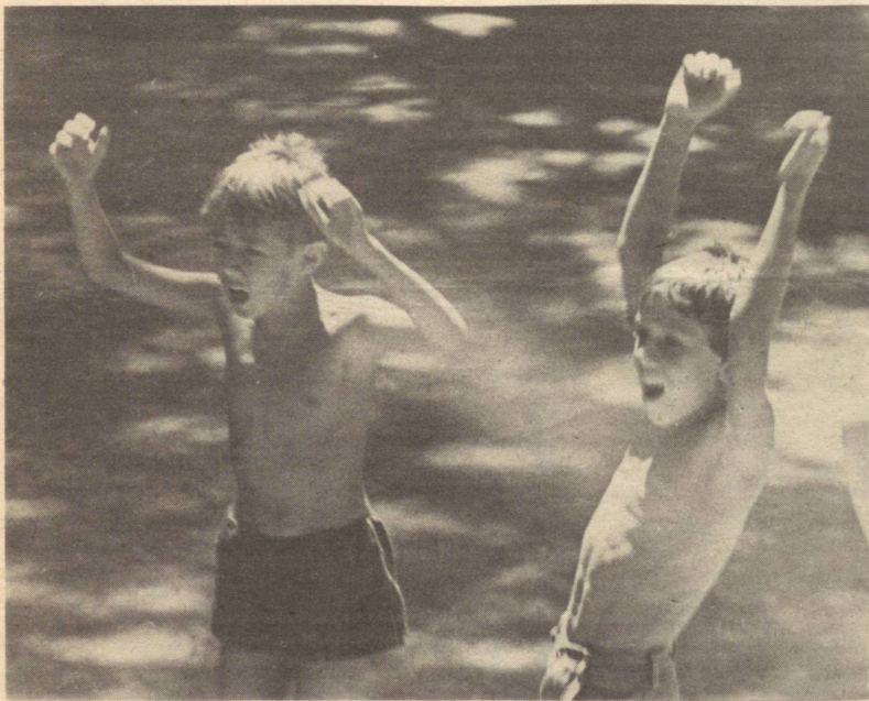
Суратчи: О. ШЕМАКОВ