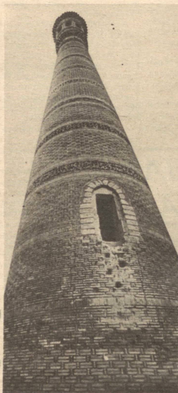
Виқор АБДУЛ ҒАНИ ЖУМА сурати

IV. 1995 йил 3 март жума—муборак Рамазон ҳайити куни бўлиб ҳайит намози кун чиққандан 15 дақиқа ўтгач ўқилади.