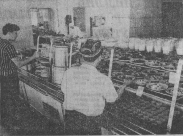
Фрунзе трестига қарашли ошхоналар, қаҳвахоналар, буфетлар мана шундай ноз-неъматлар билан тўлиб туради.

Байроқдор трестнинг азамат коллективи ҳаётга тадбиқ қилаётган янгиларни пойтахтимиздаги бошқа район умумий оқатланиш тармоқларида ҳам қизғин қўллаб-қувватлашга лойиқдир.