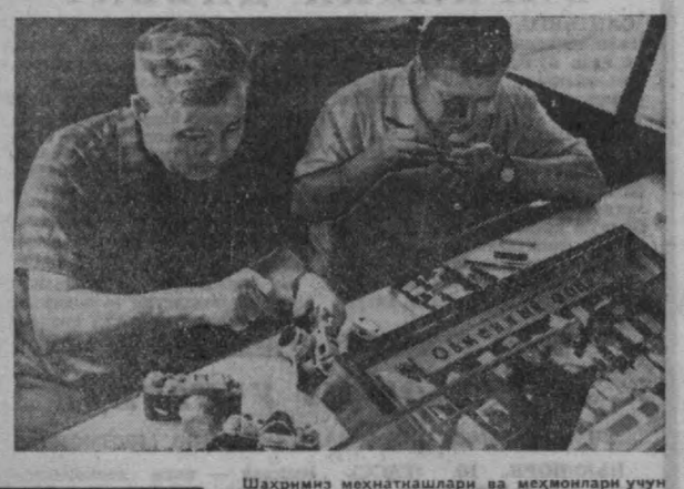
Шаҳримиз меҳнатнашлари ва меҳмонлари учун яна бир нулайлик яратилди. «Ремонтмех» номинати «Тошкент» меҳмонхонаси қошида фото аппарат ва соатсозлик устандони оқди.