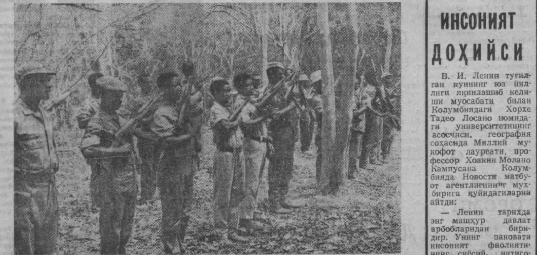
Гвинея (Бисау) халқи Португалия мустамлакчиларининг қўшнларига қарши овозлиқ курашини давом эттирмоқда. СУРАТДА: Гвинея овозлиқ кучларининг отрядларидан бири.

Италиянинг прогрессив жамоатчилиги Германия бундестагининг бир гуруҳ депутатлари Редер ва ССнинг собик ошертурма-барфюрер Каллер сингари нацист каллексларга берилган жазонинг енгиллаштириш учун ҳаракат қилётганини ҳақиқат хабарини газаб-қанди кутиб олди. Бу жоннатчилар Италиянинг Гаэта шаҳридаги турмада умрбод қамқоқ жазосини ўтамоқдалар.