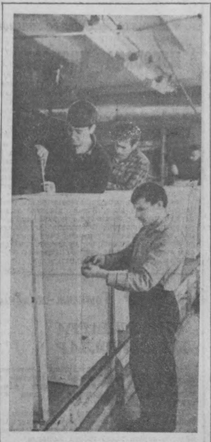
Урта Осий республикалари иқлимга мослаб тановиллаштирилган «Оазис-2» ҳолодликнига бўлган талаб кун сайин ортиб бораётти.

«...Сибсий маданиятининг, сибсий морфининг мақсади, — деган оди В. И. Ленин, — чин коммунистларнинг тарбиялаб етиштиришдан иборат...» Автокомбинатимиз партия комитети коммунистларнинг ўтган йилиги сибсий маориф ўқувини ташкил этиш, ҳар бир машғулотнинг самарадор бўлиши учун курашда доҳийликнинг ана шу суларига доимо амал қилди.