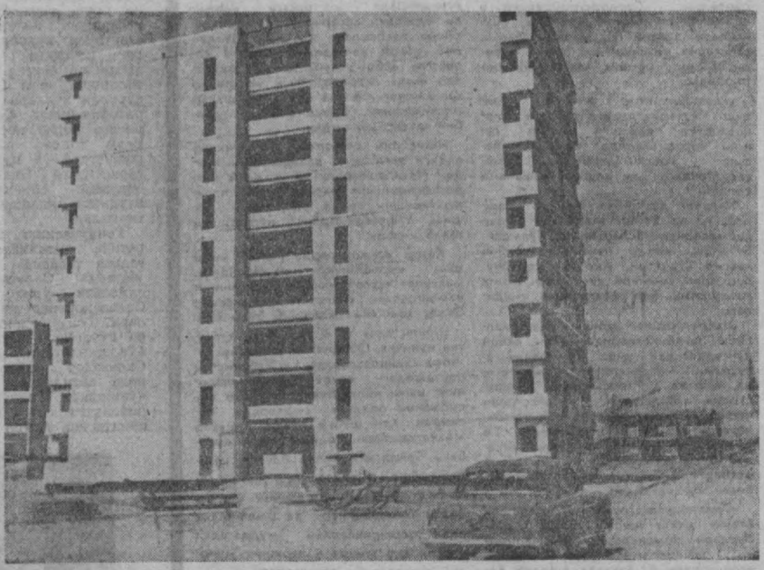
Азми шаҳримизда ҳар кунини бир неча янги бино ва маданий-манший объектлар фойдаланишга топширилади. СУРАТДА: кунингача «Марказ-5» да Новосибирск қурилиш-монтаж поезди бинокорлари томонидан фойдаланишга топширилган 9 қаватли турар-жой биноси.

«Марказ-4» кварталидagi уйларга кўчиб кетган ондаларга маданий-манший хизмат кўрсатиш ишлари ҳам эътибордан четда қолдирилмаган. Кварталда Воронеж қурилиш-монтаж поездининг меҳнат аҳли Жамоат марказини қурмоқда. Олти минг юшига хизмат қиладиган Жамоат марказининг лойиҳасини Москва меъморлари чиқиб беришган. Икки қаватли тушбичида бинодо озик-оқват, сановат моллари билан савдо қилинади. Бунёдкорлар иш суръатини тезлатиб Жамоат марказини шу йилнинг охиригача фойдаланишга топширишмоқчи. Бундан Жамоат марказлари қурилишини тошкентлик бинокорлар ҳам олиб бориляпти. 5-қурилиш трести «Янгиобод» массивида, 10-қурилиш трести эса Қоракандида Жамоат марказларини бунёд қилмоқда. Улар шу йилнинг охиригача аҳолига хизмат кўрсата бошляпти.