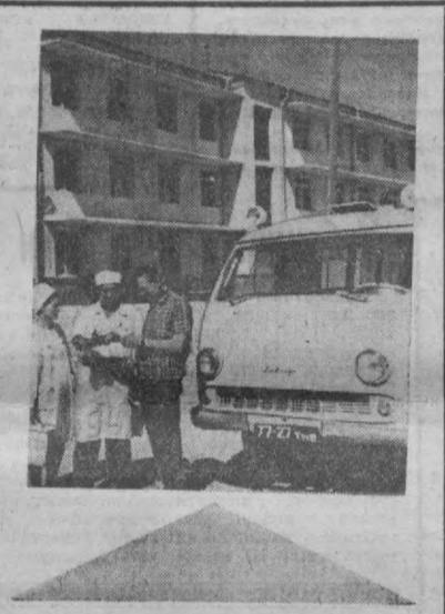
СУРАТДА: клиника биноси қурилиши.

Бундан ташқари Чилонзор, Ленин, Ҳамза, Сергели районларида ҳам қурувчилар фидокорона меҳнат қилиб, қурилиш ишларини тез суръатларда олиб бориляпти. Бу районларнинг ижроа қомителари учун махсус биноклар қурилади. Хуллас, шаҳримиз аҳолиси бунёдкор қурувчилардан доҳий В. И. Ленин юбилейи арафасида жуда кўп совғалар олади.