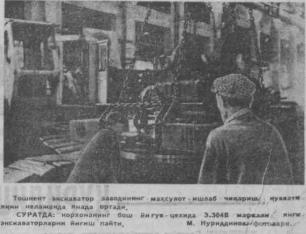
Тошкент экскаватор заводининг маҳсулот ишлаб чиқариш, қуввати лани неламада янада ортади. СУРАТДА: корхонанинг бош йиғув-цеҳида 3.304В маркази янги экскаваторларни йиғиш пайти, М. Нуриддинов/фотографи.

ТОШКЕНТ ГАЗЕТАЛАРДА + КПСС Марказий Комитетининг Бош секретари Л. И. Брежнев ва СССР Олий Совети Президиумининг Раиси Н. В. Подгорний Польша Бирлашган ишчи партияси Марказий Комитети ва Польша Халқ Республикаси давлат кенгашининг таклифи биноан, халқ Польшанинг 25 йиллиги муносабати билан ўтказилган тантаналарда иштирок этиш учун Польша Халқ Республикасига борадилар. + Ўзбекистон ССР Олий Совети Президиумининг Фармони билан Уртоқ Носир Маҳмудов Ўзбекистон ССР халқ контроли комитетининг раиси қилиб тайинланди. + 17 июлда Ўзбекистонда қирғиз адабиёти ва санъати дендасини ўтказувчи ташкилот комитетининг мажлиси бўлиб ўтди. Мамлакатимиз халқлари қардошларининг мана шу янги байрамий бу йил сентябрь ойида ўтказишга қарор қилинди.