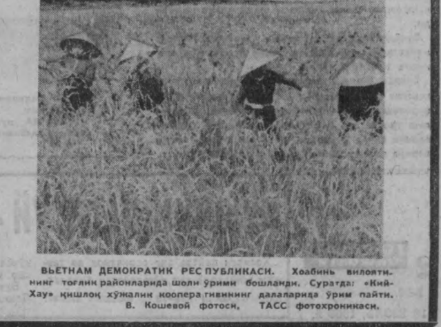
ВЬЕТНАМ ДЕМОКРАТИК РЕСПУБЛИКАСИ. Хоабини вилоти-нинг тоғлик районларида шол ўрини бошланди. Сурагда: «Кий-Хай» қишлоқ ҳўжалиқ кооперативининг далаларида ўрми пайти.