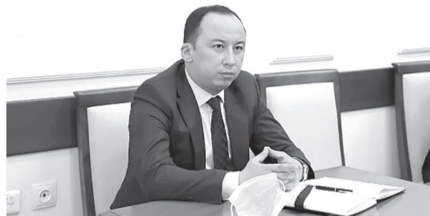
Нодир АБДУВАЛИЕВ, Олий Мажлис Қонунчилик палатаси депутати.

билан барча соҳалар, жараёнларга татбиқ қилинаётган ошкоралик, шаффофлик баъзи ташкилотларга тегишли эмас, шекилли.