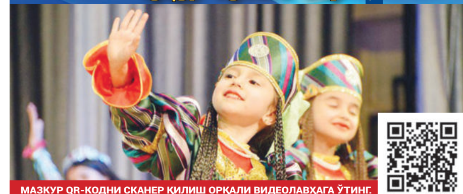
МАЗКУР QR-КОДНИ СКАНЕР ҚИЛИШ ОРҚАЛИ ВИДЕОЛАВҲАГА ЎТИНГ.