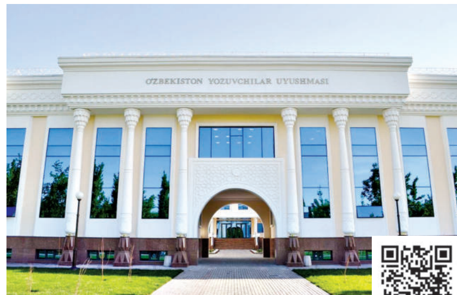
МАЗКУР QR-КОДНИ СКАНЕР ҚИЛИШ ОРҚАЛИ ВИДЕОЛАВҲАГА ЎТИНГ.

"Шарқ" нашриётида чоп этилган ушбу рисола Афтондил Эркинов нашрга тайёрлаган, унга Ўзбекистон халқ шоири Эркин Воҳидов мухтасар сўзбоши ёзган. "Бир гуруҳ адабиётшунос олимларимиз тарихимиздаги бу кемтикликни тўлдириш мақсадида "айби" подшолик бўлган шоирларимизнинг асарларини жам этиб, нашр этаётган экан, бу хурриятимиз маҳсули, тарихий адолатнинг тикланиши, деб ҳисоблайман", деб хулоса қилади Э.Воҳидов. Хусайн Бойқаро ўз рисоласида Алишер Навоий ҳақида бундай ёзди: "Мир Алишер "аслаҳаллоху шонаху"ким, тахаллуси Навоийга машхурдурур ва ашъорида бу тахаллус мастур. Турк тилининг ўлган жасади- га Масиҳ анфоси била руҳ кюрди ва