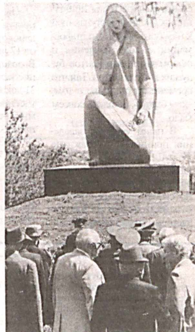
На снимках: моменты празднования Дня Победы.

инам, могилу Ш. Рашидова, возложив на них цветы. Ветераны были окружены всеобщим вниманием, участвовали в многочисленных встречах с молодыми сотрудниками органов внутренних дел, вспоминали о минувшем за дружеским дастарханом. Необходимо, чтобы такое отношение к ветеранам второй мировой войны не ограничивалось праздничными днями, а было постоянным.