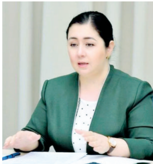
Феруза ЭШМАТОВА, Олий Мажлиснинг Инсон ҳуқуқлари бўйича вакили (Омбудсман)