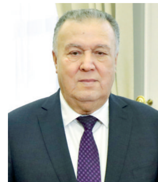
Бахтиёр САЙФУЛЛАЕВ, Олий Мажлис Сенати Ёшлар, маданият ва спорт масалалари қўмитаси раиси