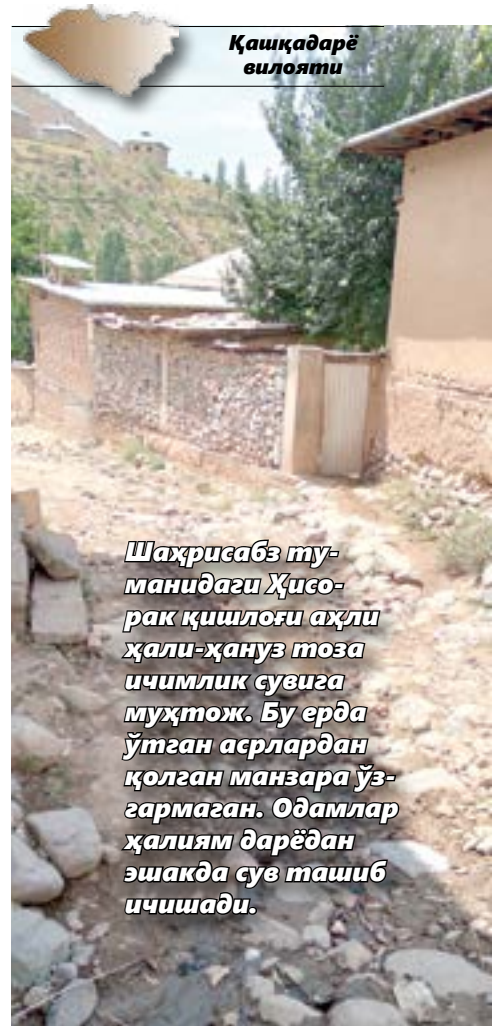
Шахрисабз туманидаги Ҳисорақ қишлоғи аҳли ҳали-ҳануз тоза ичимлик сувига муҳтож. Бу ерда ўтган асрлардан қолган манзара ўзгармаган. Одамлар ҳалиям дарёдан эҳкамда суе ташиб ичишади.