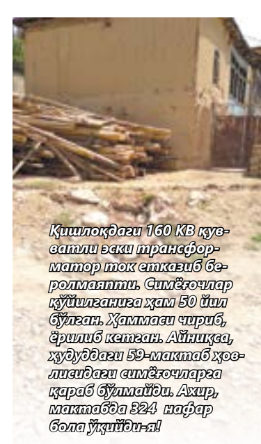
Қишлоқдаги 160 КВ қувватли эски трансформатор ток етказиб беролмаяпти. Симёғочлар қўйилганига ҳам 50 йил бўлган. Ҳаммаси чириб, ёрилиб кетган. Айниқса, ҳудуддаги 59-мактаб ҳовлисидаги симёғочларга қараб бўлмайди. Ахир, мактабда 324 нафар бола ўқийди-я!

яна сел келади, яна бузилади. Хуллас, аҳоли ички йўлларнинг дам-бадам бузилишидан безиб қолган. Бизнес қишлоқ ҳам «Обод қишлоқ» дастурига киритилармикан-а? Қишлоқдаги 160 КВ қувватли эски трансформатор ток етказиб беролмаяпти. Симёғочлар қўйилганига ҳам 50 йил бўлган. Ҳаммаси чириб, ёрилиб кетган. Айниқса, ҳудуддаги 59-мактаб ҳовлисидаги симёғочларга қараб бўлмайди. Ахир, мактабда 324 нафар бола ўқийди-я! Янги трансформатор ўрнатиш, симёғочларни янгилаш бўйича Шахрисабз тумани электр таъминоти корхонасига бир неча бор мурожаат қилинган. Улар ҳам фақат ваъда беришдан нариға ўтишмаган. Қишлоқдаги мактабда ҳам муаммолар бисёр. Спорт зали, фаоллар зали йўқ. Истиқом тизими талабга жавоб бермайди. Ҳисорақда қиш 4-5 ой давом этади. Бир тонна кўмир техника харажатидан ташқари 500-