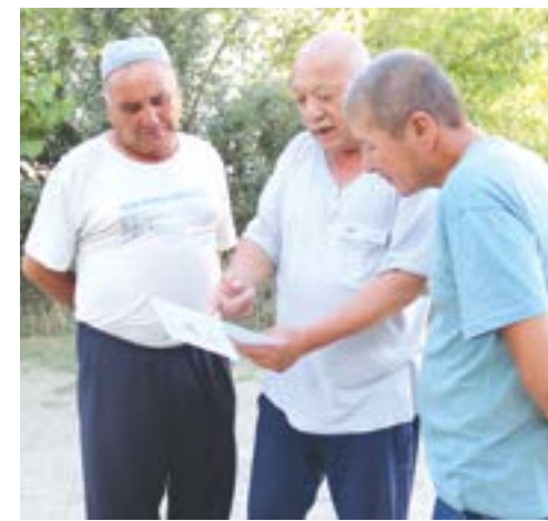
кувурлар орқали ҳақиқий табиий газ линиялари тортиб берилган...

Газ «булоғи»га бориб кўрамай. Кўчаларга тортилган қувурлар турли ўлчамда. Эйтиборимиздаги кўчага кетган қувур чиндан ҳам ингичка, бунинг устига, шундоққина хонадон деворлари ости, ер узра тортиб кетилган. Бу хавфли эмасми? Мурожаатни «ёпиш», далолатнома тузиш учун келган мутасадди чинакам масъулият ҳис этганида, газ «томирлари»га тартиб берган бўлармиди, деб ўйлаб қолдик.