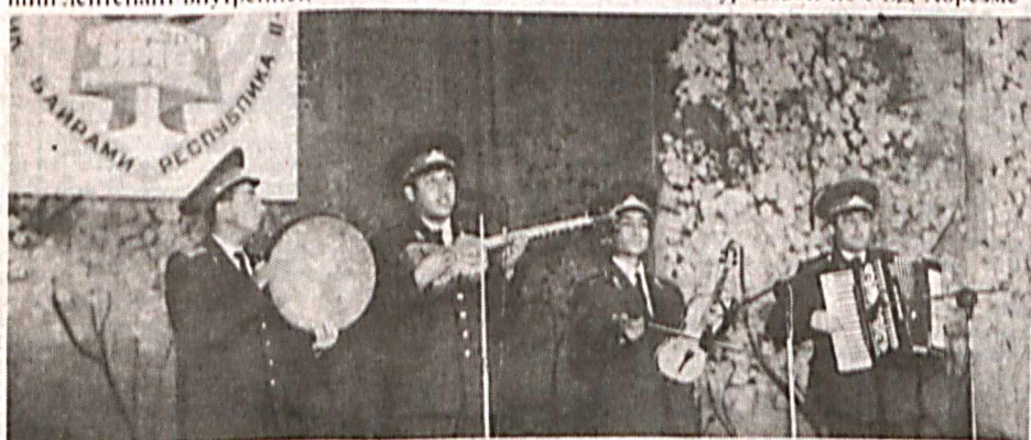
На снимке: фрагменты заключительного концерта.