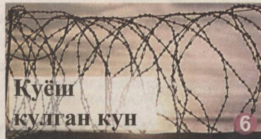
Куёш кулган кун