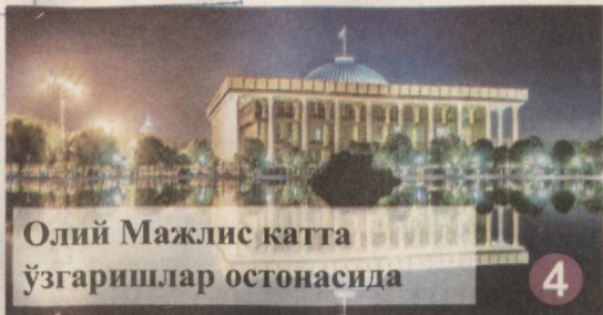
Олий Мажлис катта ўзгаришлар остонасида