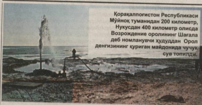
Қорақалпоғистон Республикаси Мўйноқ туманидан 200 километр, Нукусдан 400 километр олида Возрождение оролининг Шағала деб номланувчи ҳудуддан Орол денгизининг қуриган майдонида чуқук сув топилди.