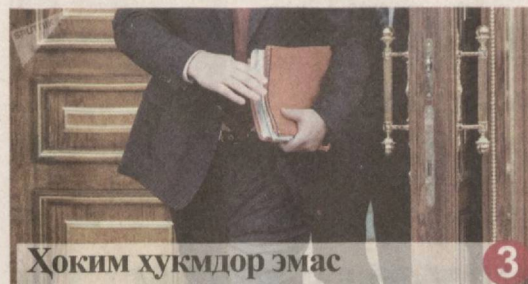
Хоким ҳукмдор эмас