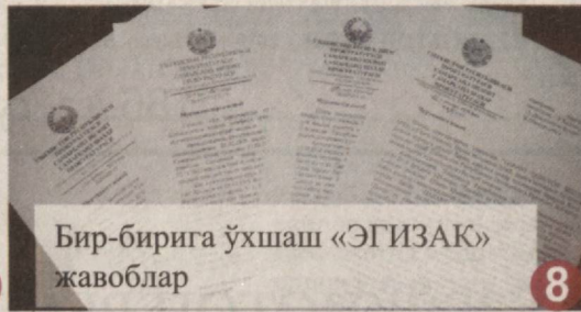
Бир-бирига ўхшаш «ЭГИЗАК» жавоблар