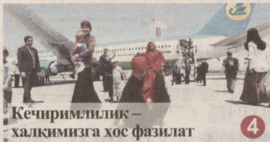
Кечиримлилиқ — халқимизга хос фазилат