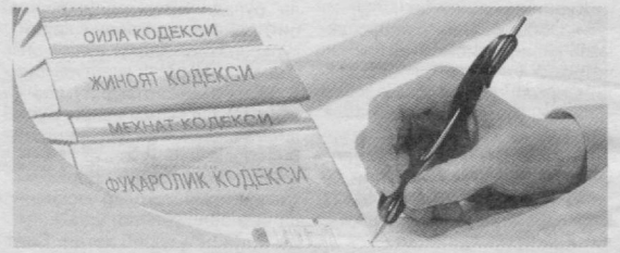
Ф. АБДУВАЛИЕВ, Бош прокураторнинг бошқарма катта прокурори

Қардорнинг ижро ҳужжатдаги талабларини ижро этиш учун етарли бошқа мол-мулки бўлмаган тақдирда, ундирув суд ҳужжати асосида қардорнинг масъулияти чекланган жамиятининг, кўшимча масъулиятли жамиятининг устав фондидаги (устав капиталдаги) улушига, тўлиқ ширкатнинг, ком-