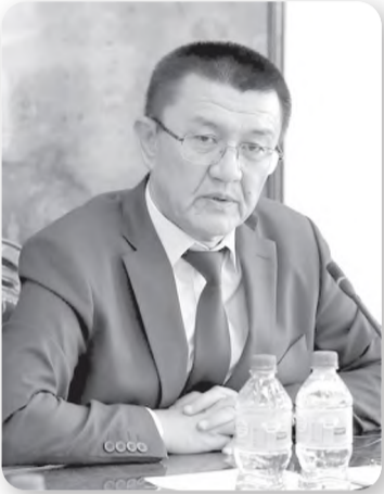
Холмўмин ЁДГОРОВ, Ўзбекистон Республикаси Судьялар олий кенгаши раиси:

Қонунчиликка киритилаётган янгилликлар суд органлари фаолиятининг сифат жиҳатидан ўзгаришига амалий таъсир кўрсатади. Судьяларнинг шу мавзудаги фикр-мулоҳазалари билан қизиқдик. Қуйидаги давра суҳбатида қонунчиликка киритилган янгилликлар, унинг мазмун-моҳияти, амалий аҳамияти ҳақида сўз боради.