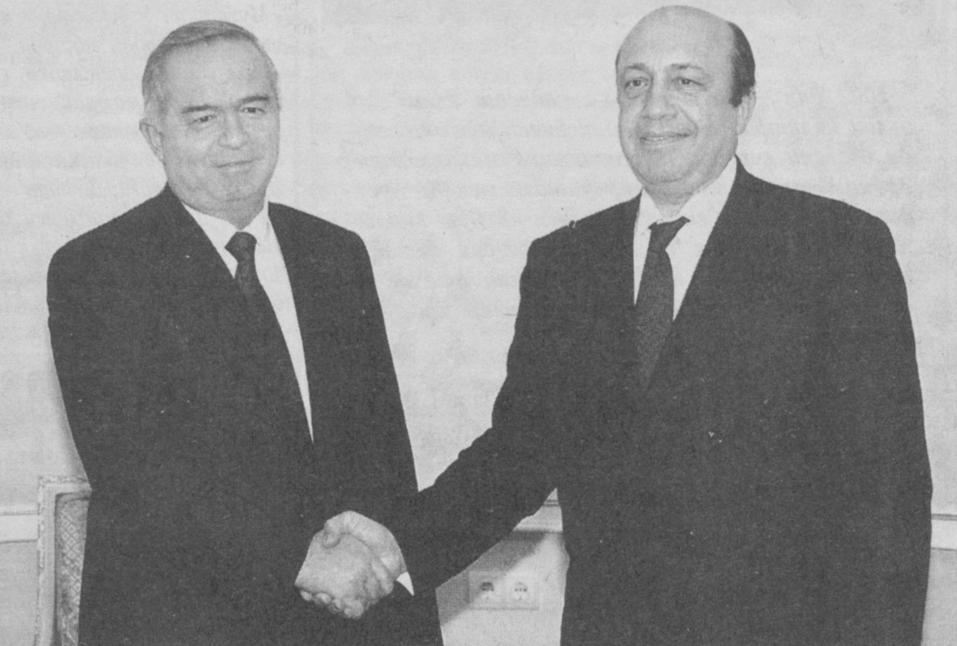
Ўзбекистон Республикаси Президенти Ислам Каримов 9 январь кунин Оқсаройда Россия Федерацияси ташқи ишлар вазири Игор Ивановни қабул қилди.

фаоллик билан ривожланмоқда. Ўзбекистон билан Россиянинг ҳамкорлиги иқтисодий соҳада ҳам кенгайиб борапти. 2001 йилнинг январь-ноябрь ойларида ўзаро товар айирбошлаш ҳажми аввалги йилнинг шу даврига нисбатан 15 фоиз ўсиб, 1 миллиард 28,6 миллион АҚШ долларини ташкил этди. Айни пайтда томонлар бу кўрсаткич миқдорини ошириш, қўша корхоналар сонини кўпайтириш, шунингдек, икки мамлакатнинг авиасозлик корхоналари қувватидан шериклик асосида кенг фойдаланишга эътиборни янада кучайтириш масалалари борасида ишламоқда.