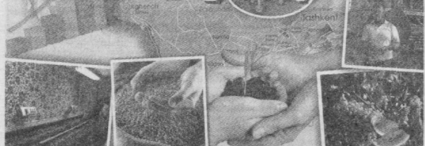
[Давоми. Бошланиши 1-бетда/

Б ош прокуратура, Инсон ҳуқуқлари бўйича Республика Миллий маркази, Республика Савдо-саноат палатаси, Олий ҳўжалик суди, Республика Марказий банки ҳамда Самарқанд вилоят ҳокимлиги ҳамкорлигида ўтказилган ушбу тадбирда Самарқанд вилоят прокуратураси, СВОЖДЛКК Департаменти, Ички ишлар органлари, божхона, солиқ, банк муассасалари ходимлари, кичик бизнес ва хусусий тадбиркорлик субъектлари, хонармандлар, кенг жамоатчилик ҳамда журналистлар иштирок этдилар.