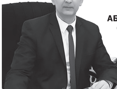
Баҳром АБДУҲАЛИМОВ, Олий Мажлис Қонунчилик палатаси Спикери ўринбосари.

Мазкур хавфдан ҳамма ҳадиксираб тургани, соғлиғи ва хотиржамлигини йўқотган бўлишига қарамай, уни даф этувчи қурол — вакцина бағрикенглик билан қарши олинмади, очиғи. Бунга вакцина атрофида айланаётган миш-мишлар сабабдир.