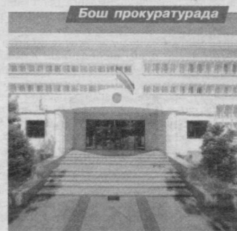
2012 йил 25 апрелда Ўзбекистон Республикаси Бош прокурори Р.Қодиров Монголия Бош прокурори Дорлигжав Дамбини бошчилигидаги делегацияни Ўзбекистонга ташриф доирасида қабул қилди.