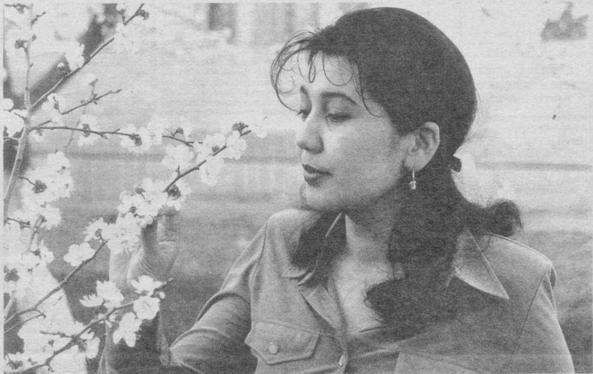
«Урмим баҳорисан, баҳор!»