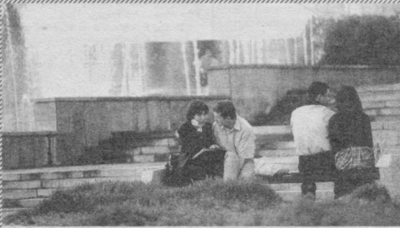
«Дил-дилга мос бўлса...»

Португалия полициячиси машинани бошқариб кета туриб соқолини қиртишлаётган ҳайдовчини тўхтапти. Ҳайдовчи инспекторга жуда муҳим учрашувга шошилаётганини, у ерга эса соқоли ўсган ҳолда боролмаслигини тушунтириш учун роса овора бўлди. У машина манглайидаги кўзгуга қараб ҳам соқол қиртишлаган, ҳам рулни бошқарган. Инспекторни ажаблантирган нарсга ҳайдовчи шу ҳолатда ҳам соқолини бинойидек қиртишлагга улгурганлиги бўлди.