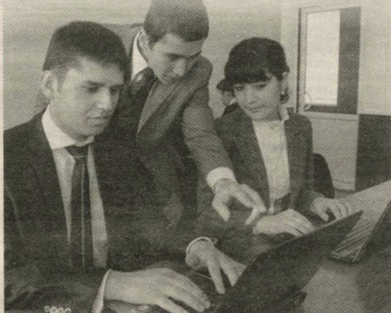
[Давоми. Бошланиши 1-бетда]

уни ҳимоялашнинг ҳуқуқий асослари такомиллаштирилди