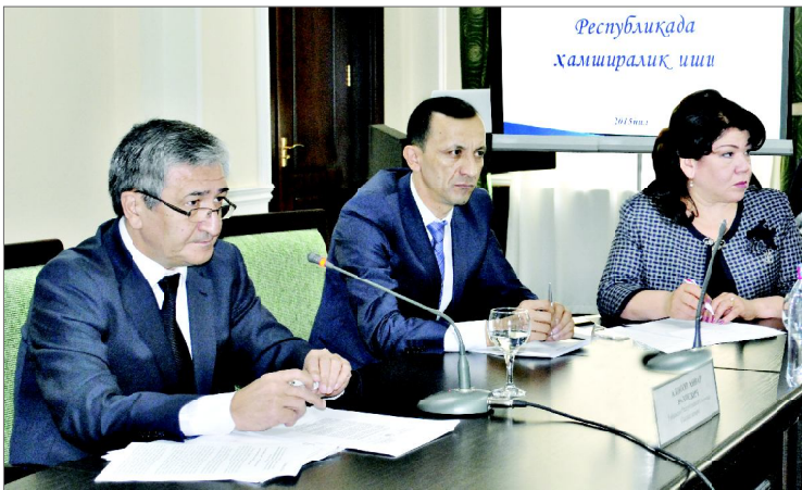
2015 йилнинг 25 ноябрь куни Ўзбекистон Миллий матбуот марказида Ўзбекистон Республикаси Соғлиқни сақлаш вазирлиги томонидан "Ўзбекистонда ҳамширалик иши: бу борада тўпланган тажриба ва истиқболдаги вазифалар хусусида" деб номланган навбатдаги матбуот анжумани бўлиб ўтди.

Тадбирда Ўзбекистон Республикаси Соғлиқни сақлаш вазирлигининг мутасадди раҳбарлари, Қорақалпоғистон Республикаси Соғлиқни сақлаш вазирлиги, Тошкент шаҳар ва вилоят соғлиқни сақлаш бошқармалари бош ҳамширалари, пойтахтимиздаги тиббиёт коллежларининг директор ва директор ўринбосарлари ҳамда оммавий ахборот воси-