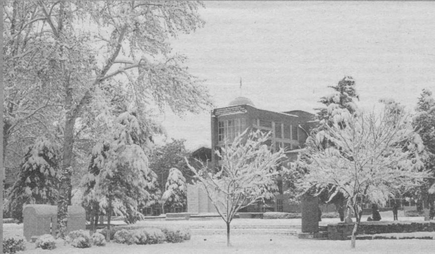
Қорли кунлар ҳам ганимат...