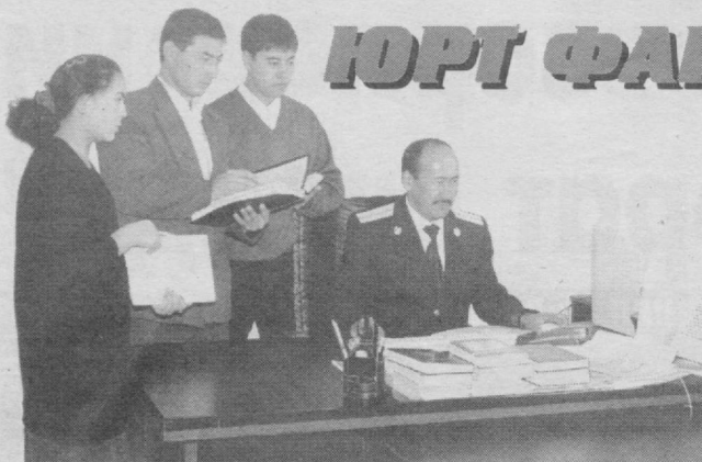
Паркент туман прокуратураси ҳузуридаги СВОЖҚК бўлими ва туман солиқ инспекцияси ходимлари навбатдаги рейд олдидан

Ўзбекистон Республикаси Бош прокуратураси ҳузуридаги Солиқ ва валютага оид жиноятларга қарши курашиш Департаменти фаолиятдан