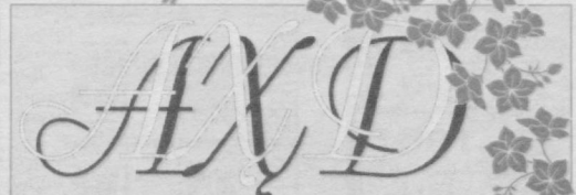
(Давоми. Бошланиш 3-бетда).

Талабаликнинг олтига тенг, бебаҳо лаҳзалари кўз очиб юмгулча ортда қолди.