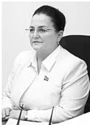
Максуда ВОРИСОВА, Олий Мажлис Қонунчилик палатаси депутати, ЎзЖДП фракцияси аъзоси: