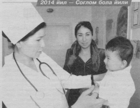
Ўзбекистон Миллий матбуот марказида республикаимизда оналар ва болалар саломатлигини муҳофаза қилиш борасида амалга оширилаётган ишлар ҳамма келгуси вазифаларга ба-ғишланган матбуот анжумани бўлиб ўтди.

Шунингдек, тадбирда Ўз-бекистон Республикаси Пре-зидентининг "Юридик кадрлар