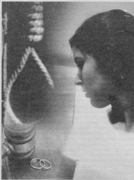
Алишер ШОКИРОВ, Бош прокуратура бошқарма катта прокурори

Юртбошимиз таъкидлаганларидек, "Онлави тарбия масаласида хатога йўл қўймаслик учун аввало ҳар қайси хонадондаги маънавий иқлимни ўзaro ҳурmat, ахлоқ-одоб, инсоний муносабатлар асосига қуриш айна муздао бўлур эди". Жамиятга қабул қилинган ахлоқ меъёрларини писанд қилмай, оналави низолар келтириб чиқараётганлар ҳам афсуски, учраб турибди.