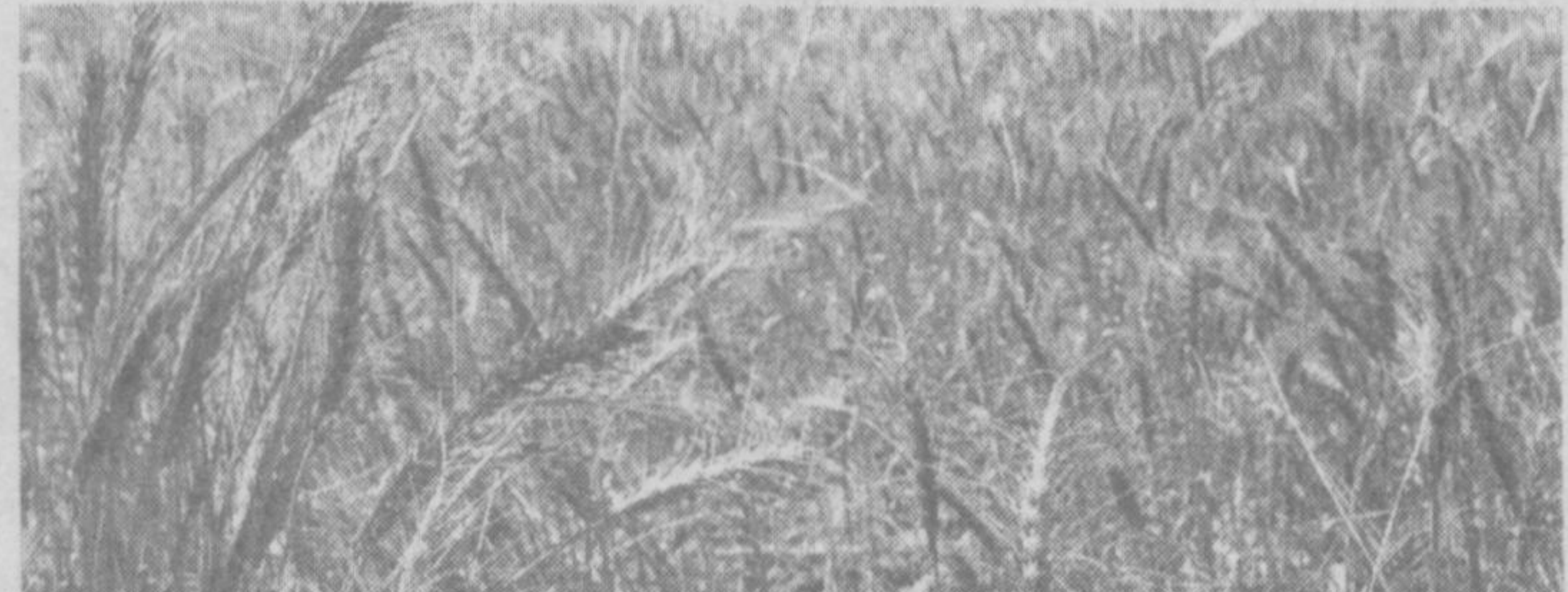
Самарқанд тумани ғаллакорлари ҳам вилоятда биринчилар қатори ғалаба маррасига етдилар. Давлатга 9 минг тонна уруғига 9 минг 54 тонна сара дон топишиб, режа удаланди. Хирмонга «Барака», «Дўстлик», «Гулистон», Ш. Рашидов, Ф. Қосимов номли жамоа хўжаликлари муносиб ҳисса қўшдилар. Урим-йилчим давом этмоқда.

Айтишларича, Сурхондарё воҳасида бу йилгидай мўл ғалла етиштирилмаган. Андижонда ёки бошқа вилоятларда гектарига 50-60 ҳатто 70 центнердан ҳосил олинганлигини эшитган бу ерлик деҳқонлар ушбу хабарнинг роҳлигига очини ишончсизламай қаради. Аммо ишга чинакам шахд билан ёндашилса, бошқалардан кам бўлмаслик мумкин экан. Аввало, воҳа иқлимига мос «Крошка», «Манка», «Половчанка» сингари ғалла навлари танлаб экилди. Уруғ экин олдиндан минерал ва маҳаллий ўғитлар берилди. Тўлиқ олинган қўчқарлар 2 марта азотли ўғитлар билан озиқлантирилиб, 4 марта қондириб сугорилди. Ғаллазорлар бетона ўтлардан тозаланди. Ғалла касалликларига қарши кимёвий тадбирлар ўз вақтида ўтказиб берилди. Натيجида 92 минг гектар майдонда мўл ва эртаги ҳосил етиштирилди. Урим-йилчим эса май охиригидай бўлиб юборилди.