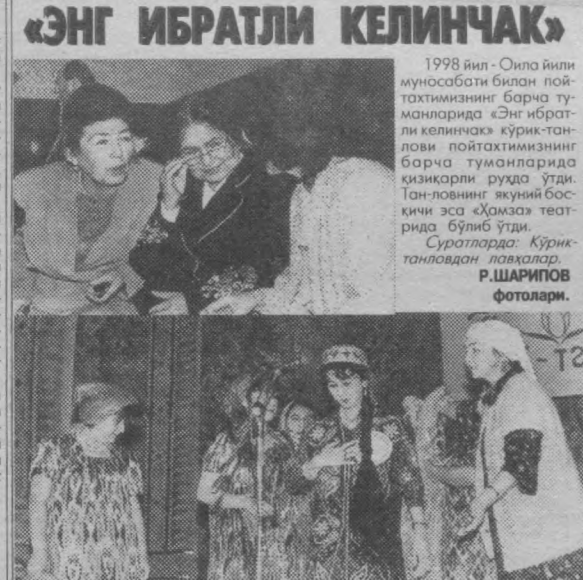
«ЭНГ ИБРАТЛИ КЕЛИНЧАК» 1998 йил - Ойла йили муносабати билан пой-тахтимизнинг барча ту-манларида «Энг ибрат-ли келинчак» қурк-тан-лови пойтахтимизнинг барча тумонларида қизқарли рўхта ўтди. Тан-ловнинг уқийни бо-сийси эса «Дамза» теа-трида бўлиб ўтди. Суратларда: Қўриқ-танловдан лавалар.

олди. Биз маҳалла оқсоқолларининг йиғилишдан олган таассуротлари билан қизиқдик. М.Исмаилова: Тўғриси, бу йиғилишнинг бунчалиқ бахсли бўлишини кўтимаган эдик. Ўзимиз бил-маган қонунларни сўраб, билиб ол-дик. Муоммолар қўл экан. Энг асо-сийси, очик-ойдин гапилашдик. Эндиги масала бу муаммоларни аҳдлик билан ҳал қилишди. С.Мухаммадиев: Халқнинг ҳуқуқий маданиятини оширишда бундай юз-ма-жум улукотларнинг ўрни бекиёс. Агар ана ўшандай урчушувлар тез-тез ташкил қилинса, халқнинг дилидаги ишлар бўларди. Биз тушунамиз, про-курорнинг ҳам ҳокимининг ҳам иш-лари қўл, муаммолари ўзларига етар-ли. Бирок, одамларнинг ўз ҳақ-ҳуқуқларини яқши билса, бундан факат жамиятимиз ютарди. Халқимизнинг ҳуқуқий маданияти тезроқ оқсалса, юртимиз раванки ҳам шунчалик тезлашади. Юртбоши-миз таъжибланганликдех, ҳуқуқий маданиятнинг юқори даражада бўлиши ҳуқуқий давлатнинг ўзига хос хусусиятидир. Зайиндин МАМАДАЛИЕВ.