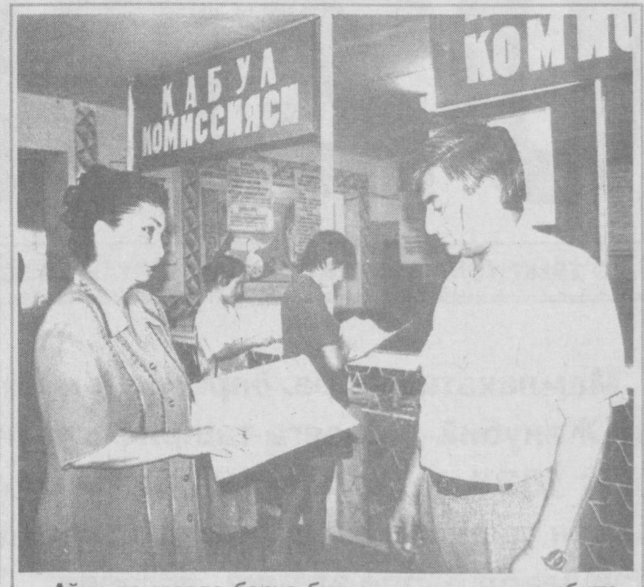
Айни дамларда барча билим масканларида абитурентлар ўзи хоҳлаган соҳа бўйича олий ўқув юртыга ҳужжатлар топширмақда. Жумладан, Чирчиқ тиббиёт билим юртыда ҳам ана шундай жараён кўзгич паллада. Бу йил мазкур ўқув юртыга 250 нафар ёшнинг талабалikka қабул қилиш кўзда тутилган.

■ Шарофат ЙЎЛДОШЕВА, «Ўзбекистон овози» мухбири