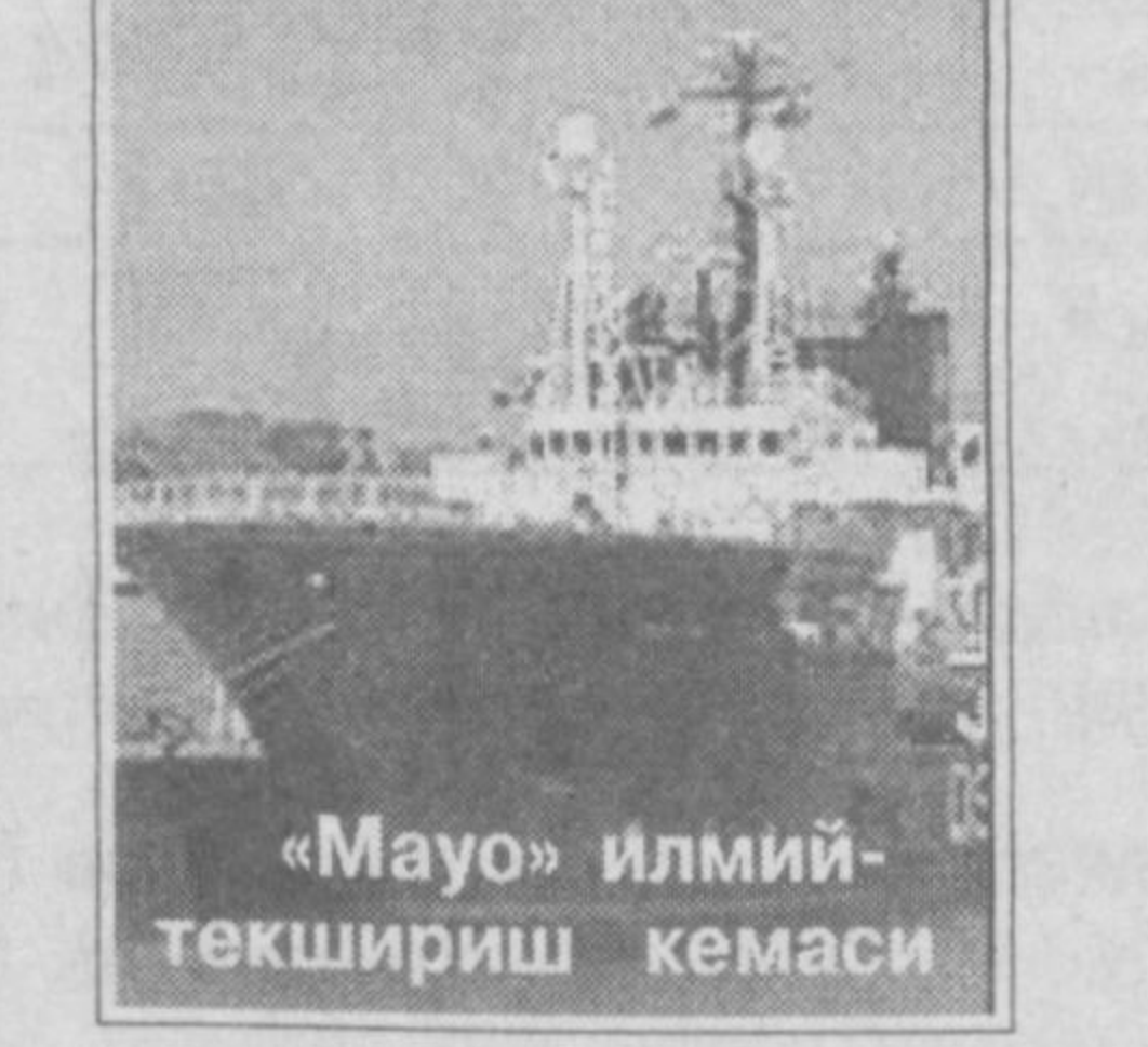
«Маю» илмий текшириш кемаси

Операциянинг биринчи босқичи низоҳасига етди. Бунда камералар ўрнатилган роботлар ёрдамида «Курск» қайта ўрганилиб чиқилди, радиация ўлчами текширилди. Хавфсизликни таъминлаш чоралари кўрилди.