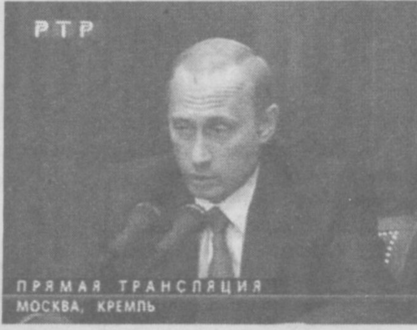
ПР ПРЯМАЯ ТРАНСЛЯЦИЯ МОСКВА, КРЕМЛЬ

Қарийб бир ярим соатдан ортиқ давом этган ушбу анжуманда 500 дан ортиқ маҳаллий ҳамда чет эл журналистлари иштирок этишди. Президент Гөнеяда бўладиган «Катта сажизлик» давлатлари раҳбарларининг учрашувида кўриладиган масалалар, Россия — Хитой янги алоқалари, Россиянинг Жаҳон савдо ташкилотига қўшилиш масаласи, АҚШнинг Ракетадан мудофаа тизимини яратиш дастурига муносабати ва бошқа ички сиёсий ҳамда халқаро масалаларга доир саволларга ўз фикрини билдирди.