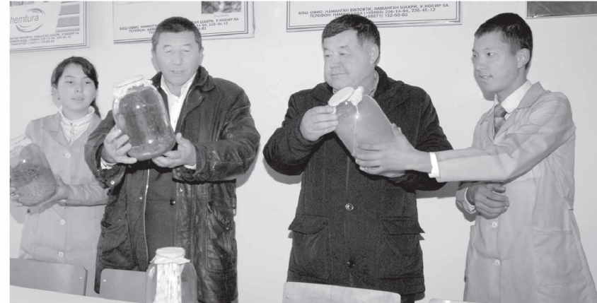
«Фермерлар ўқув маркази» қишлоқ мулкдорлари ва коллеж ўқувчиларининг билими ва тажрибасини оширувчи масканга айланади.

– Ушбу ўқув марказлари фаолияти билан танишиб, туманида ташкил этилаётган шундай марказ учун керакли барча нар-