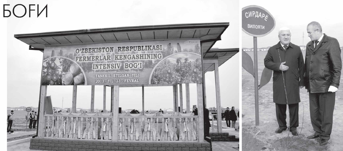
Интенсив боғқа дастлабки кўчатни вилоят ҳокими ва Республика Фермерлар кенгаши раҳбари ўтқазиди.

ҳосил олиш имконияти катта. Гулистон туманидаги «Назарқул голиб нияти» фермер ҳўжалигида ана шундай имкониятдан унумли фойдаланиб, янги интенсив боғ ташкил этилмоқда. Ушбу боғ замонавий ва тежамкор технологияга асосланган бўлиб, сугорилиш томчилатиб сугорилиш технологияси ёрдамида амалга оширилди. Замонавий технология эрининг дарахт учун керакли намга тўйинганига қараб ишлайди. Янни тупроқ керакли миқдорда намликка эга бўлдики, шу заҳоти компьютер суви тўхтади. Шунингдек, томчилатиб сугорилиш яна бир афзал жиҳати, у ёрдамида ўсимликни ривожлантириш мақсадида бериладиган кимёвий препаратни ҳам нихоятда тежайди. – Айни шу жиҳат учун Президентимизнинг Фармонида кўра, бизга қатор имтиёзлар берилган, – дей-