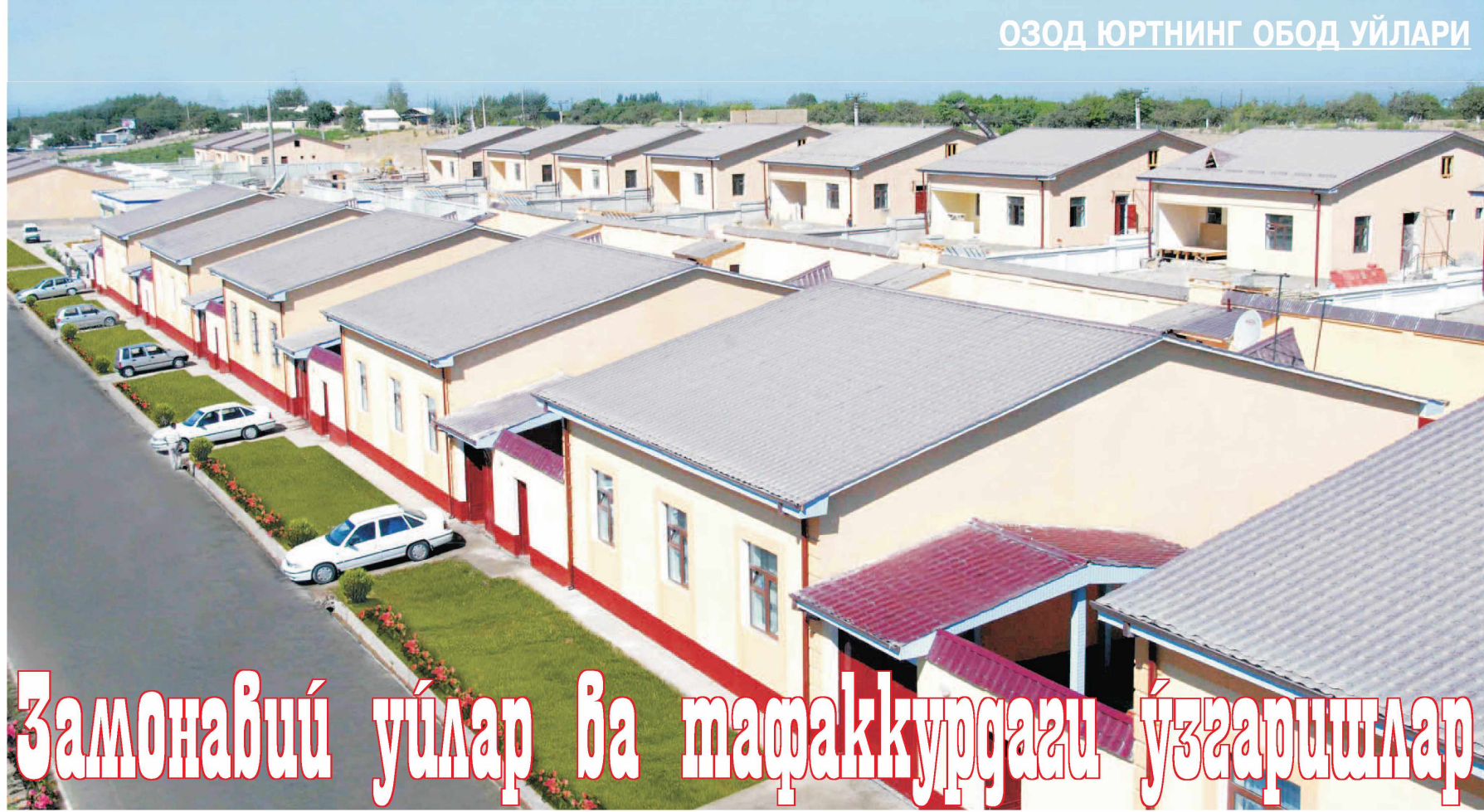
ОЗОД ЮРТНИНГ ОБОД УЙЛАРИ