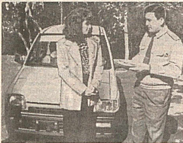
На снимке: владелице «Тико» вручается ключ.

На прошлой неделе в который раз показали старый фильм «Зигзаг удачи», фильм одновременно смешной и грустный. В те времена лотерей было меньше, и выигрыш машины считался поистине уникальным. Но и сегодня подобное явление, согласитесь, воспринимается как некое чудо, к которому у большинства примешивается еще и зудящее чувство сомнения — что-то здесь не так, наверняка какая-то подставка, своему «организмическому» счастливому билету. Это взгляд человека со стороны, обывателя, но когда сам лично встречаешься и беседуешь с удачливым обладателем выигрышного билета, сомнения рассеиваются.