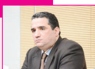
Карим ИФРАК, Франция Фанлар академияси илмий ходими, профессор

Ўзбекистон улуғ мутафаккир ва алломалар қолдирган илмий-маънавий мерос аҳамиятини чуқур англаган ҳолда, уларга ҳар қачонгидан кўра кўпроқ эътибор қаратилмоқда.