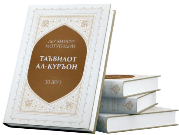
Имом Мотуридийнинг бошқа асарлари орасида тили ва услуби жиҳатдан энг энгил ҳисобланади. Шу сабабли, ахли сунна вал жамоа уламоларининг асосий манбаидир”, деб ёзади.

Шу нуқтани назардан, Имом Мотуридийнинг бу тафсири ислом илмлари таълимотида беназир бўлиб, уламолар наздида бошқа бирор аввалги ва кейинги тафсирлар унга тенгшлаша олмаган. “Кашфул зунн” китоби муаллифи Ҳожи Халифа “Таъвилот ал-Қуръон” ҳақида: “Ушбу китоб