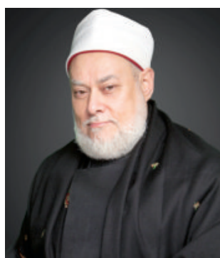
Шайх Али Жумъа таъбири билан айтганда: “Дарҳақиқат, имом, ҳужжат, суннатнинг химоячиси, бидъатни йўққа чиқарувчиси Абу Мансур Мотуридий Қуръонни раъй асосида тафсир қилган мактабнинг буюк устозларидан бири бўлган. У зот — Аллоҳ у кишидан рози бўлсин — “Таъвилот ал-Қуръон” номли сермахсул асарни ёздилар. Бу асар ўз соҳасида ягона, бу ўринда ҳужжат бўладиган бур асардир.

Шу сабабли ҳам Қуръони каримнинг тафсири ва таъвилоти бағишланган бу асар асрлар давомида ўзининг аҳамиятини йўқотмай келаяпти, унинг маъно-мазмун бугунги кунда ҳам ўта долзарб бўлиб, ижтимоий муаммоларни бартараф этишда муҳим ўрин тутмоқда.