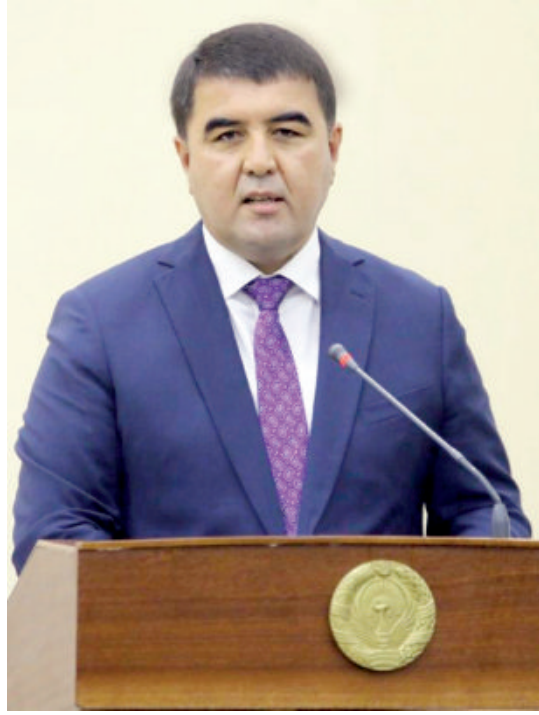
Шавкатжон АБДУРАЗЗОҚОВ, Наманган вилояти ҳокими