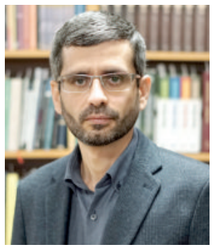
Шу сабабли ҳам Қуръони каримнинг тафсири ва таъвилоти бағишланган бу асар асрлар давомида ўзининг аҳамиятини йўқотмай келаяпти, унинг маъно-мазмун бугунги кунда ҳам ўта долзарб бўлиб, ижтимоий муаммоларни бартараф этишда муҳим ўрин тутмоқда.

Асардан кўпбаҳс ҳадислар, саҳобаларнинг сўзлари ўрин олган. Хусусан, Абдуллоҳ ибн Аббосдан нақл қилинган ривоятлар жуда кўп ўринда зикр этилди. Тадқиқотчилар тўқсонга яқин саҳоба ва тобеъининг номлари қаламга олинганини ҳисоблаб чиққанлар. Бундан ташқари, йигирмадан зиёд луғат ва тафсир уламолари фикрларидан фойдаланилгани қайд этилган. Уларнинг авваллари Али ибн Ҳамза Кисоий, Яхё ибн Зиёд Фарро, Абу Убайда Мазъар ибн Мусанно, Ибн Қутайба, Мубаррад, Зажжох туради.