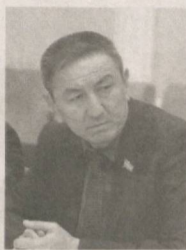
Турсунўлат НОРБОВ, Олий Мажлис Қонунчилик палатаси депутати, Ўзбекистон ХДП фракцияси аъзоси:

— Наврўз байрами руҳида яшариш, янгиликни фақат соғ-омон етганлик шукронаси, эртанги кунга, келажакка ишонч ўз ифодасини толган.