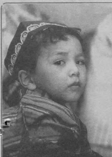
Озод элининг фарзандларимиз.