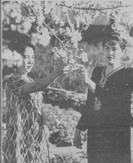
Бунча нафис экан бу гуллар.