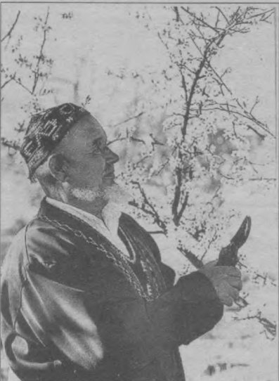
«Хар баҳорда шу бўлар тақор...»