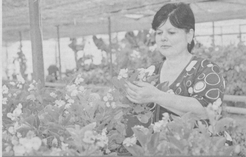
Ободонлаштириш ва кўкаламзорлаштириш ойлиги