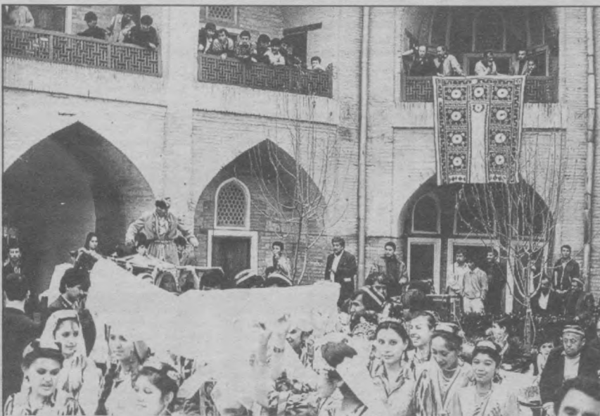
Давом этар дилларда Наврўз.

Президент Ислам Каримов тавсиясига биноан депутатлар Ўзбекистон қишлоқ ва сув ҳужалиги вазири вазифасида ишлаб келган Ислам Бобожоновни Хоразм вилояти ҳокими этиб тасдиқладилар.