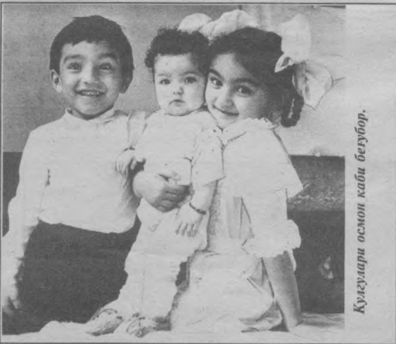
Кулгалари осмон каби беғубор.

Бўйига: 2. Чолачўл, текислик. 3. Куроллик хуруж. 4. Қадимги Юнонистондаги шаҳар-давлат. 5. Қимматбаҳо тош. 6. Туркиядаги шаҳар. 7. Базм, дабдалоли меҳмондорчилик. 11. Буюк ватандошимиз Ал-Фарғоний номига қўйилган ойдаги кратер. 12. Мазлум бир худуддаги жиноятчилик аҳоли атамоси. 15. Хитойдаги шаҳар. 16. Санъаткорларнинг умумий номи. 19. Тутқун, асир. 21. Новий вилоятидаги қодимий шаҳар. 22. Бюджетни шакллантирувчи манба. 23. Гўлуртни кашф қилган француз олими. 26. Бажариладиган маълум бир иш учун бериладиган пул. 27. Озарбайжондаги шаҳар.