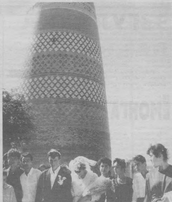
Келин-куёвларнинг тарихий обидаларни зиёрат қилишлари яхши аънамага айланган.