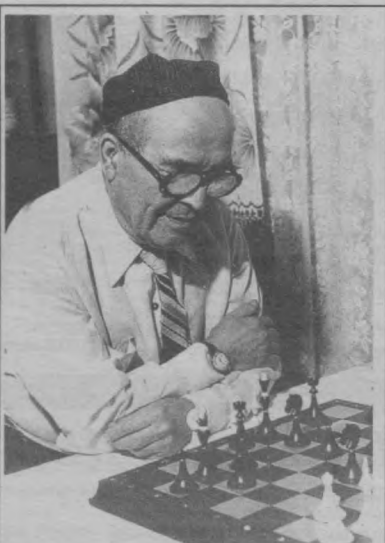
- Шахмат ақлини чарқлайди, дейишди-ю...

Газетани ўқиб, ўз кўзларига ишонмаган «мархум» тахрирларга кўнгилроқ қилади. Энди кўз ёшларга ишонмайдиган тахрирлар ҳамма кунини навбатдаги сонда узр сўрашга мажбур бўлишди.