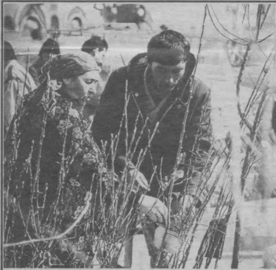
- Қўчат экиб, бог ярат: Яхшидан бог қолади, дейишади-ку.