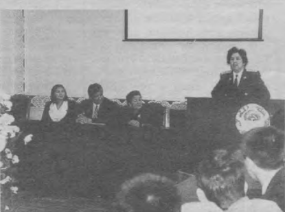
Суратда: Учрашувдан лавҳа.

уларнинг ўзаро узвийлиги, давлат сиёсатида прокурорнинг роли сингари мавзулар доирасида бўлиб ўтди. Сўхбатда М. Ражабова мазруза қилиб, жумладан шундай деди: - Бугун эски онг, эски фикр