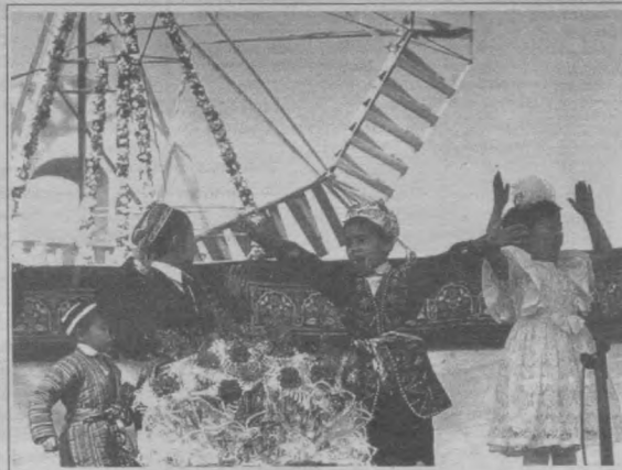
Наврўз қувончлари кичкинтойлар қалбини ҳам шодликка тўлдирди.